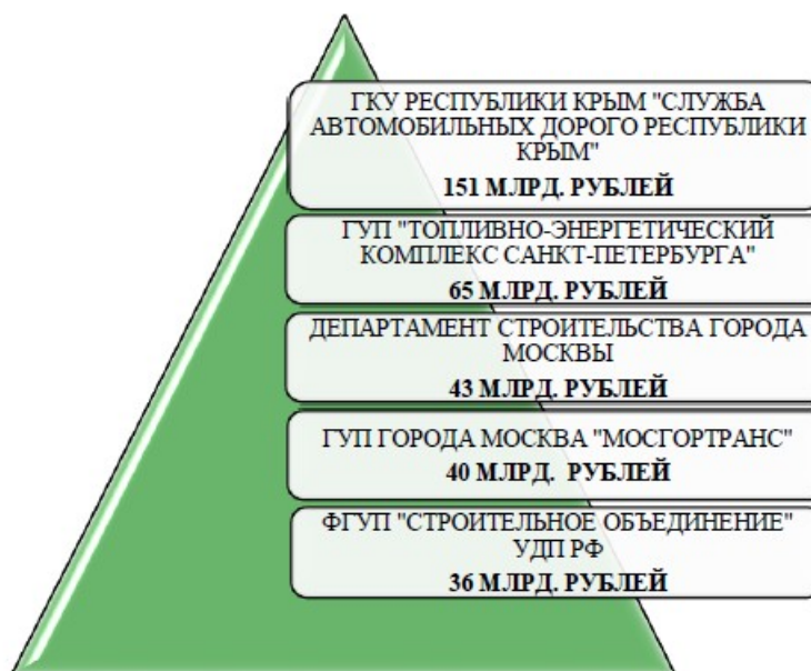
Рисунок 1. Крупнейшие закупки, обсуждение которых проводилось в 2017 г.

Информация о наиболее крупных закупках, обсуждение которых проводилось в 2017 г., представлена на рис. 1.