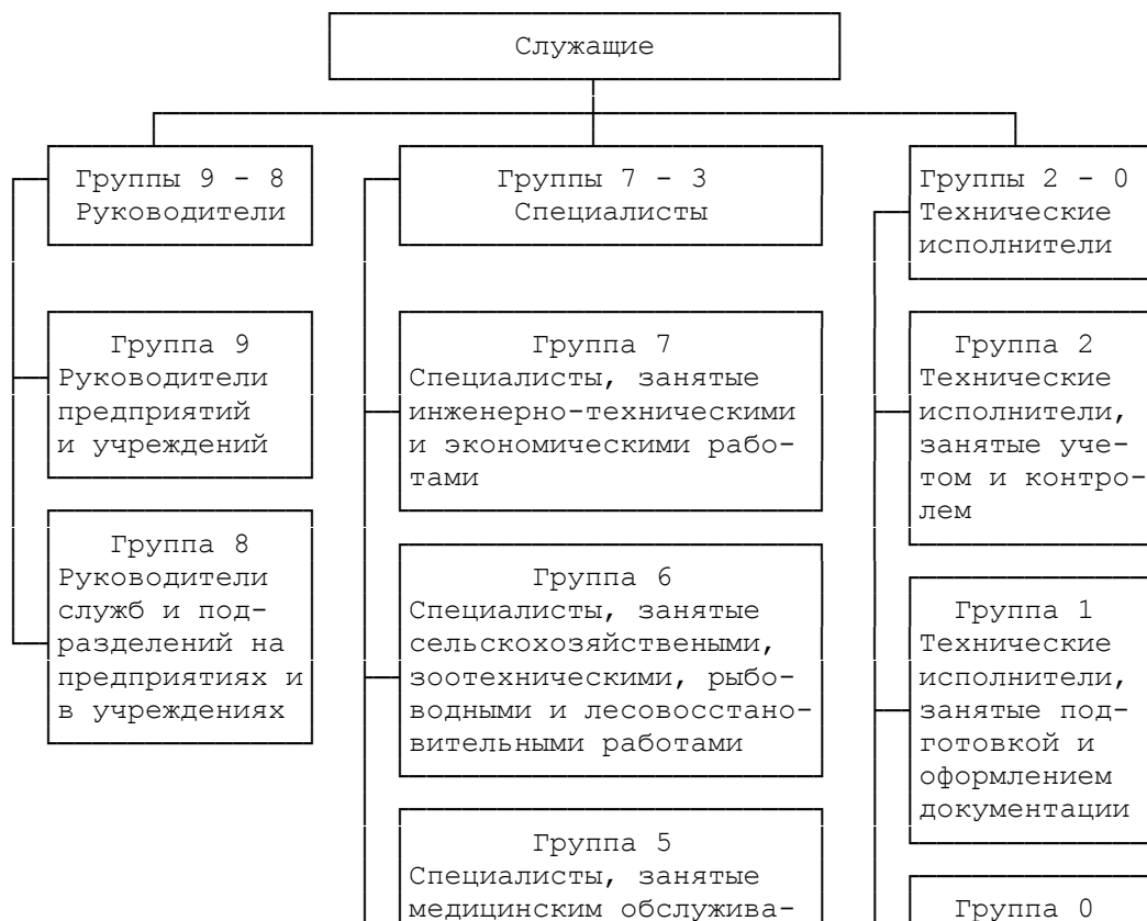
СХЕМА КЛАССИФИКАЦИИ ДОЛЖНОСТЕЙ СЛУЖАЩИХ

группа 8 - руководители служб и подразделений на предприятиях и в учреждениях.